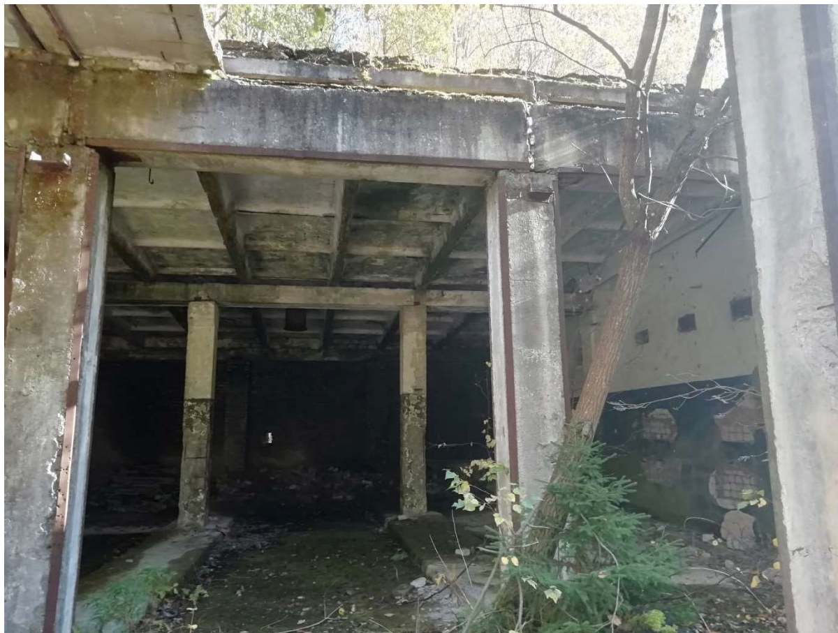
Foto 8. Hoone nr 1. Vaade hoone sees