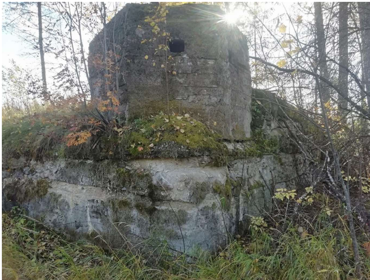
Foto 17. Hoone nr 4. Vaade hoonele põhja poolt