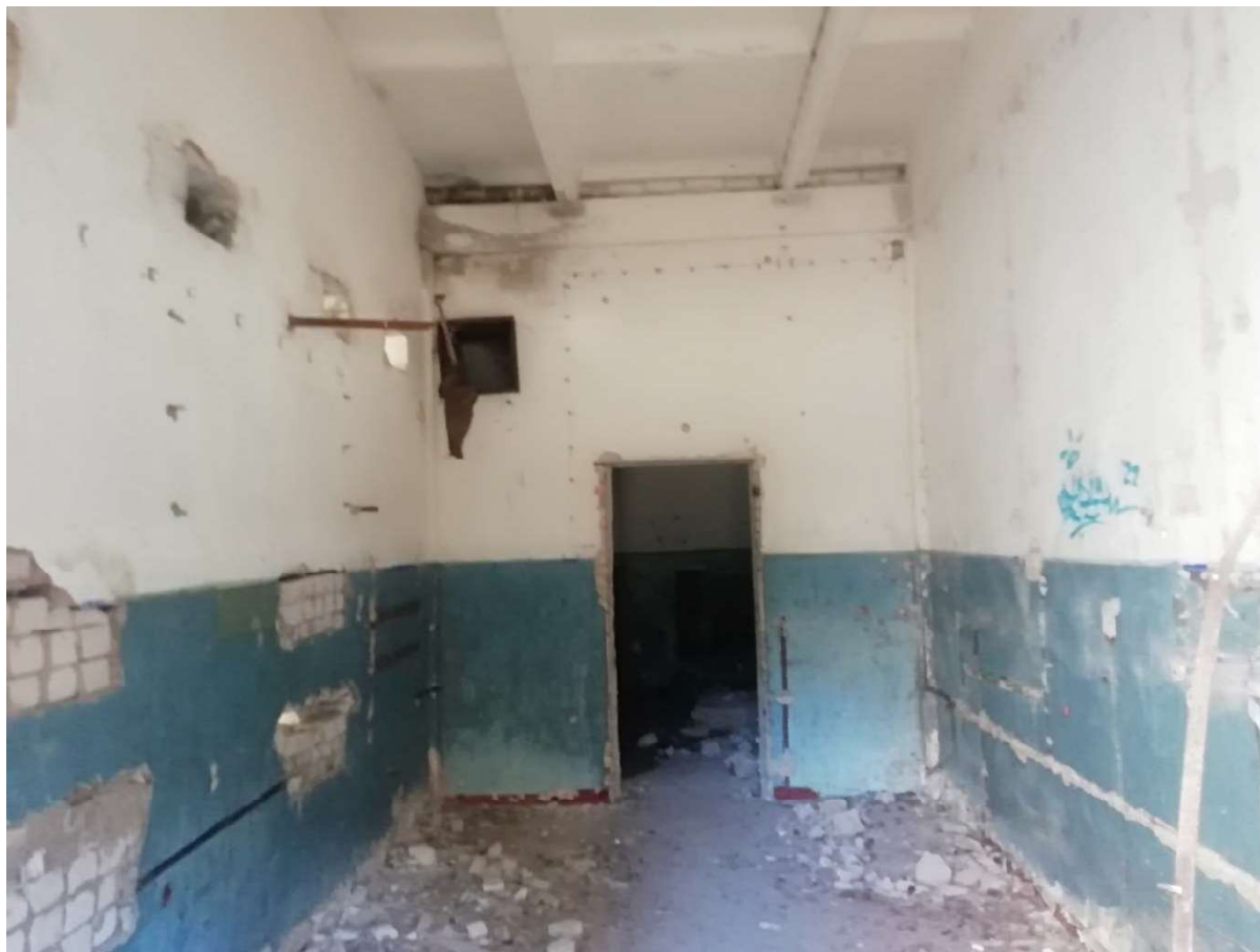
Foto 7. Hoone nr 1. Vaade seest poolt vaadates