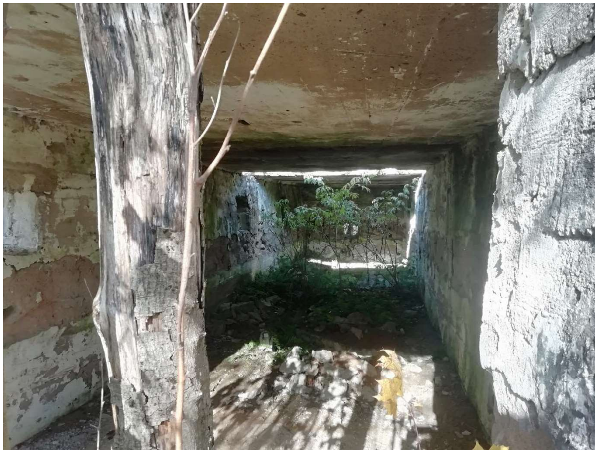
Foto 13. Hoone nr 3. Vaade hoone sees