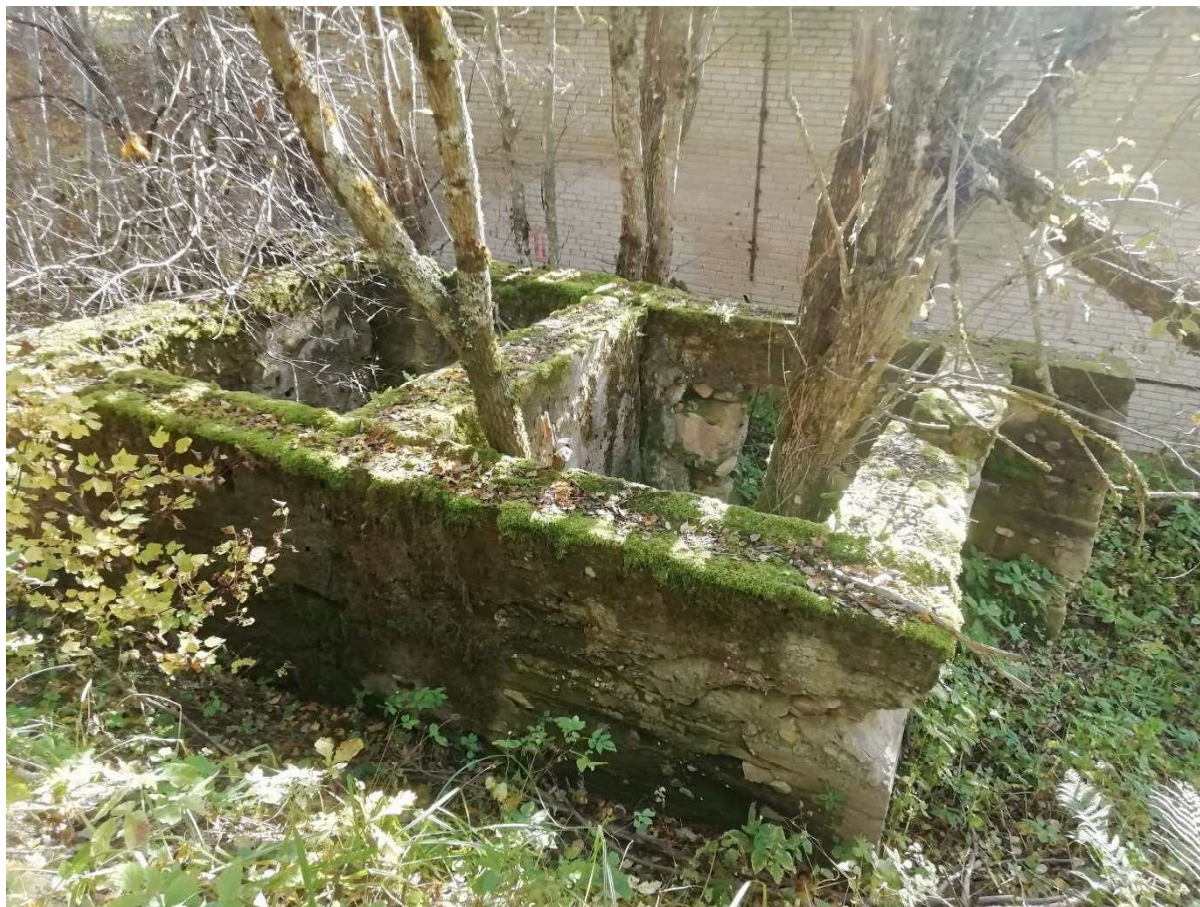
Foto 6. Hoone nr 1. Taga põhja poolt vaadates lammutamisele kuuluv rajatis