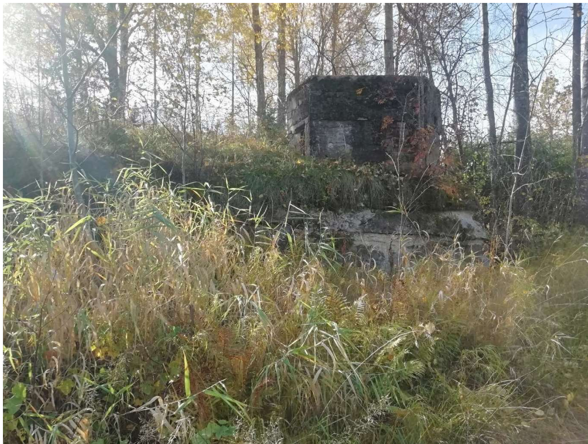
Foto 18. Hoone nr 4. Vaade hoonele ida poolt vaadates