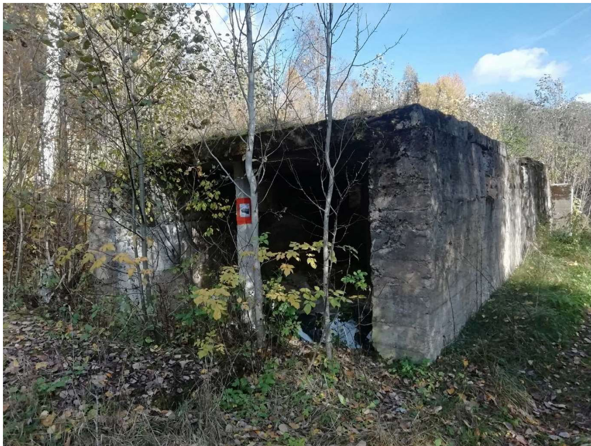
Foto 9. Hoone nr 2. Vaade lääne poolt