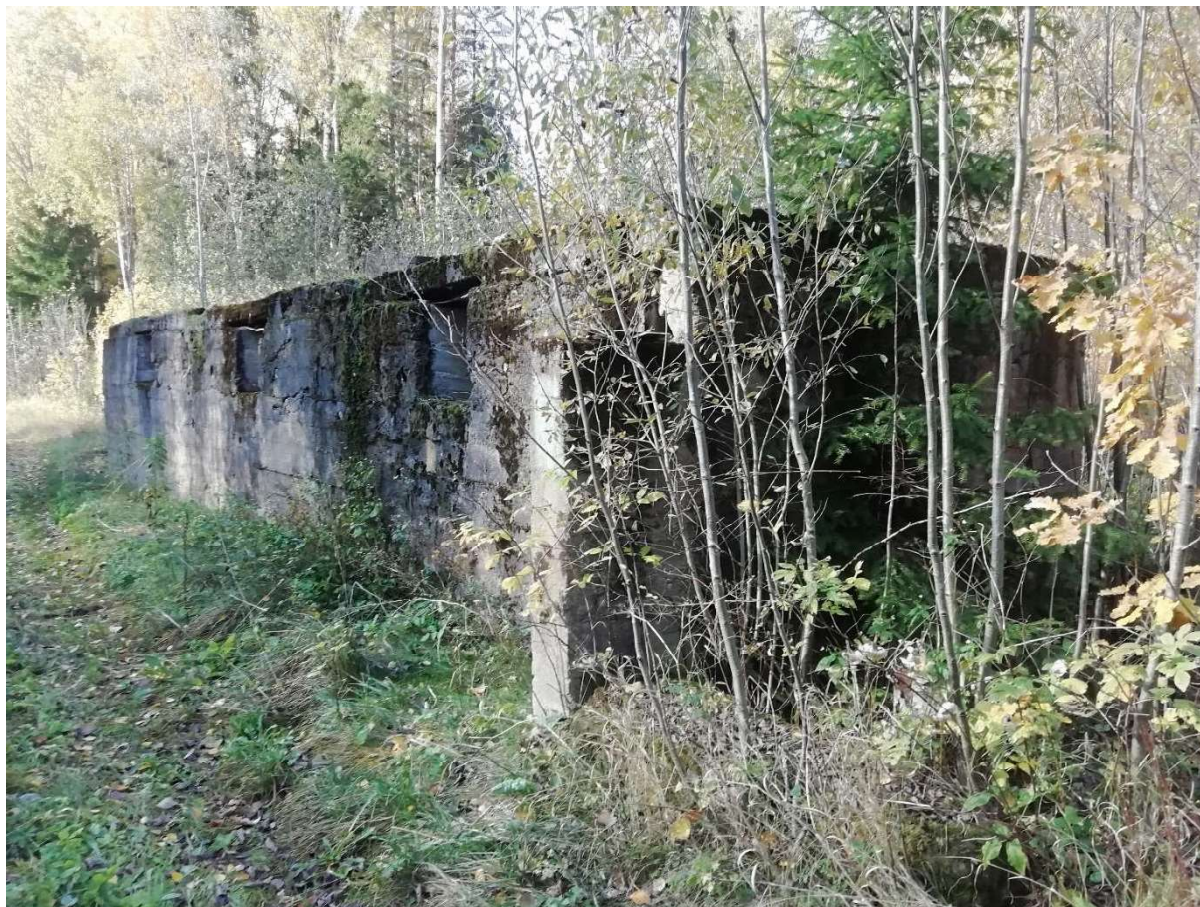
Foto 11. Hoone nr 2. Vaade hoonele lääne poolt