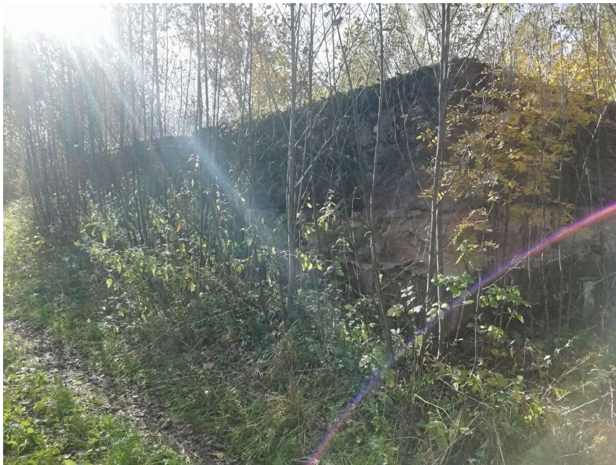
Foto 11. Hoone nr 3. Vaade hoonele põhja poolt