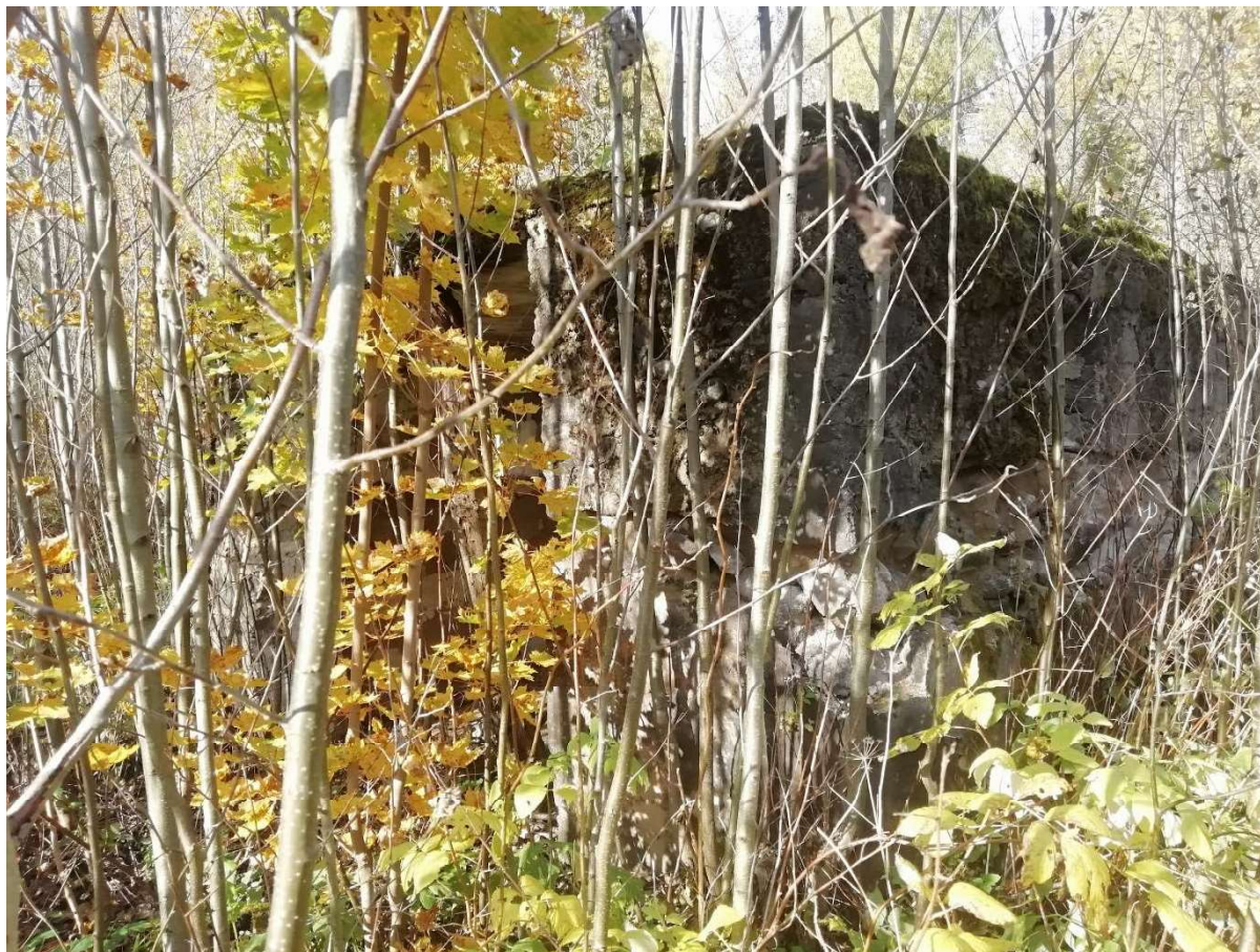
Foto 12. Hoone nr 3. Vaade hoonele lõuna poolt