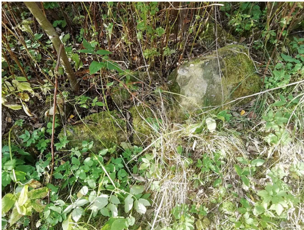
Foto 15. Hoone nr 3 maas olevad betoon plokkid hoone ümber