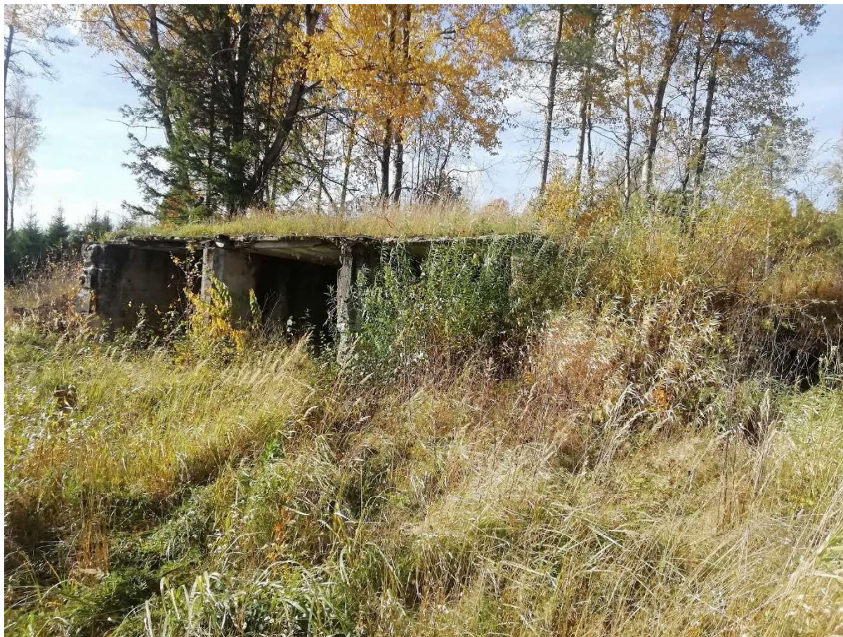
Foto 16. Hoone nr 4. Vaade hoonele lõuna poolt