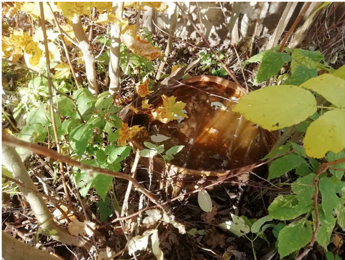
Foto 14. Hoone nr 3 maas olev ehitusprügi hoone ees