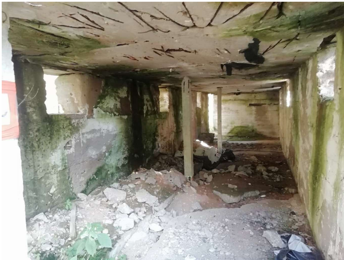
Foto 10. Hoone nr 2. Vaade hoone sees