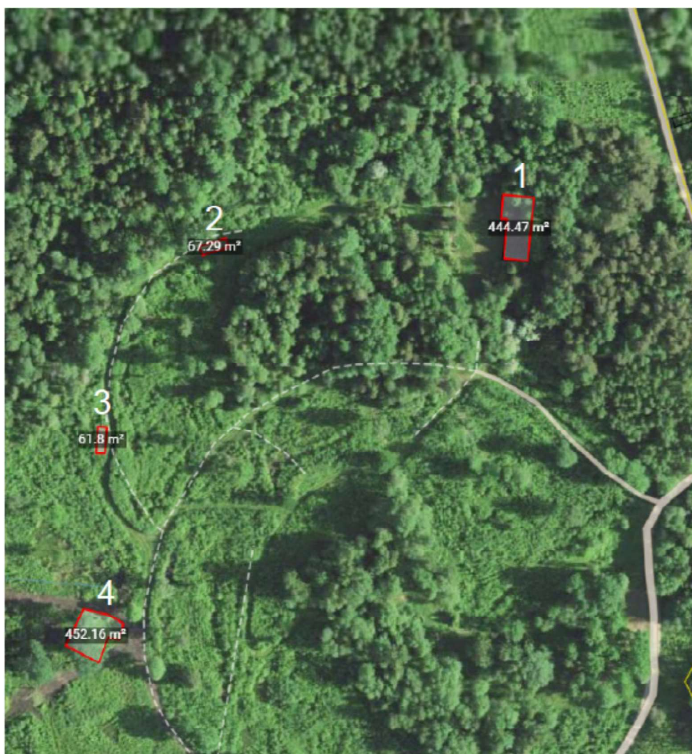
Asendiskeem nr 3 (Lammutatavate hoonete numeratsioon)

Projekteerimise aluseks on tellija soov lagunevad hooned maha lammutada, territoorium puhastada ja heakorrastada. Hoonete territooriumil on olemas sõidu tee mis peaks jääma samaks kui oli enne lammutamist. Kõik honed on varisemisohtlikud. Hoonel nr 1 puudub läänepoolne osa ning on avatud, katusekatte osaliselt mahavarisenud, kuigi hoones säilinud enamuse välis ja siseseinad koos katuse konstruktsioonidega. Hooned nr 2 ja 3 on ristkujulised ja sarnased oma kujuga, samuti varisemisohtlikud ning metsaga kinnikasvanud. Hoonel nr 4 on olemas sise ja välisseinad koos katusega, kuigi ehitise puudega kinni kasvanud ja varisemisohtlik.